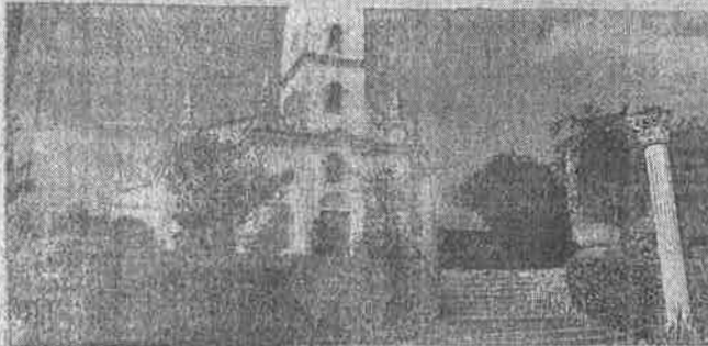
A POUSADA dos Capuchinhos em Guaramiranga, a 99,5 quilômetros de Fortaleza

Os valores arrecadados serão revertidos para o convento e para a pousada. "Como os fleis sempre desejam dar um presente, uma lembrança, direcionamos isso como uma ajuda para todos os que estão no convento", explica. "Uma das consequências da pande-